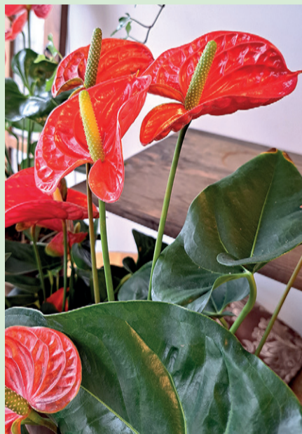
Skarpt skimrande röd anthurium, ofta kallad rosenkalla.