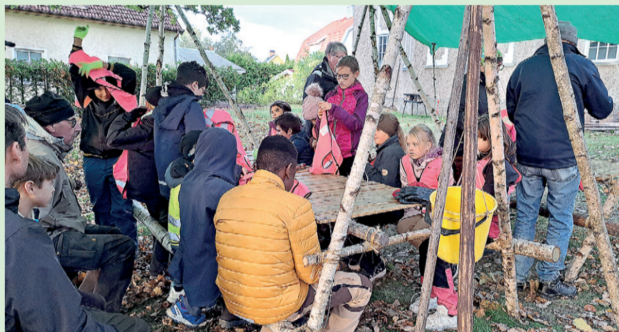
Obligatorisk påtagning av reflexvästar, kvällen kommer att skymma snabbt och då är reflexer bra både i skog och samhälle.