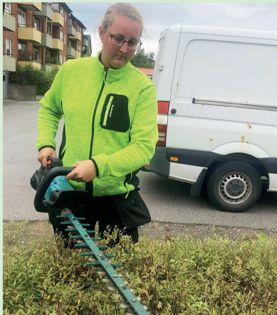
Jennie i färd med att trimma häckar