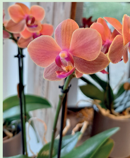
Fantastisk orkidé i aprikos och ceris.