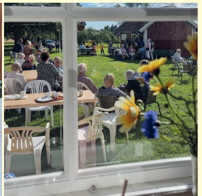
100-årsjubileum på Stora Mellösa Hembygdsgränd.