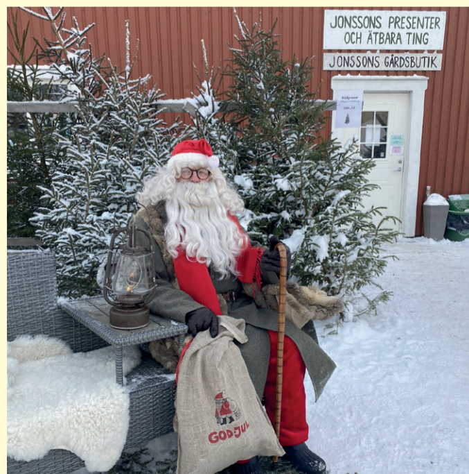
Det planeras för julmarknad på första advent.

Det har varit mycket olika aktiviteter på gården. "Loppisar" började de med innan de öppnade gårdsbutiken. Det brukar vara några gånger per år. Den största brukar vara efter Midsommar. Utställare och Röda Korset bjuds in.