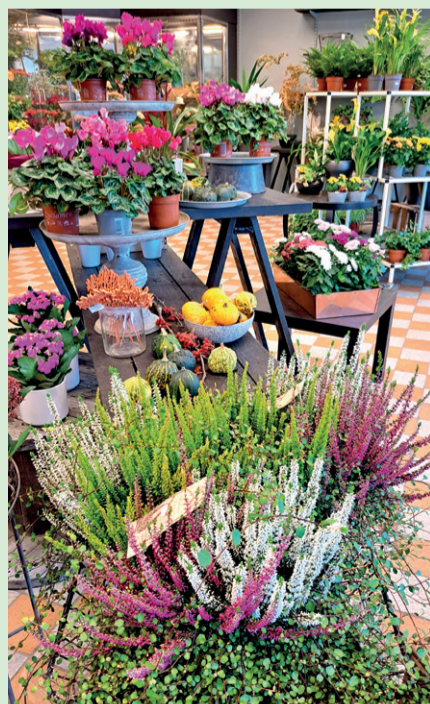
En härlig färgkavalkad med bland annat ljung, plättar på tråd, cyklamen, kalanchoe och krysantemum. I bakgrunden skymtar kylan med ännu mer färgprakt.