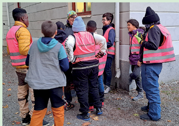
Ett glatt gäng som diskuterar en av tipspromenadens frågor.