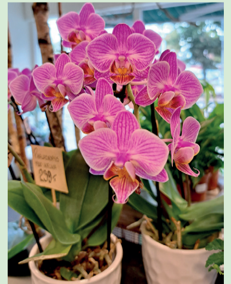
Klassisk rosa phalaenopsis, orkidé i rosa och vitt samt med gult inslag.

Frilagda blomman är en vacker germini i en mjuk kulör.