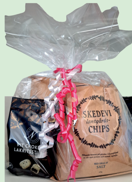
En presentpåse med bland annat lakrits och chips.

I den lilla butiken finns det många godsaker att förgylla vardag och helg