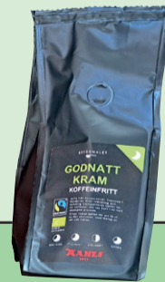
Kaffe passande för kvällen.