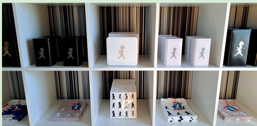
En del av produkterna från Solstickan som säljs i butiken.