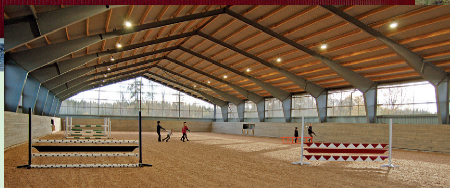
Här förbereds för enklare hoppträning.