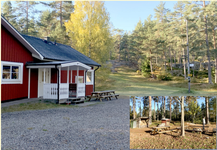
Sportstugan med pulkabacken i bakgrunden. Infälld: en av grillplatserna, denna finns intill den stora gräsplanen.

Föreningen som bildades 1946 fyller 75 år i år och elljusspåret fyller 50 år, detta firas med att byta ut omkring hälften av de 70-talet trästolpar som bär upp belysningen, en satsning på runt 350.000 kronor där Örebro kommuns landsbygdsnämnd bidrar med hälften av pengarna. De nya stolparna beräknas vara på plats i år.