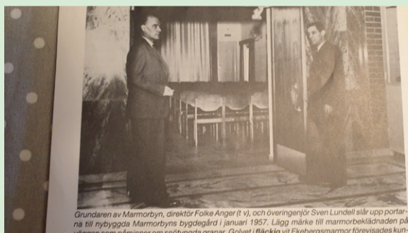
Öppningen av lokalen 1957.