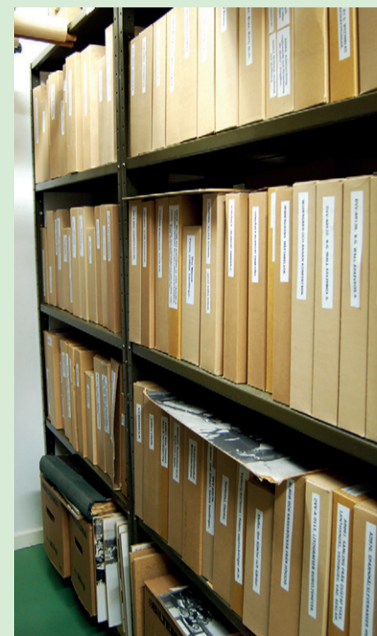
I arkivet finns hyllmetrar av dokument och cirka 6000 bilder.