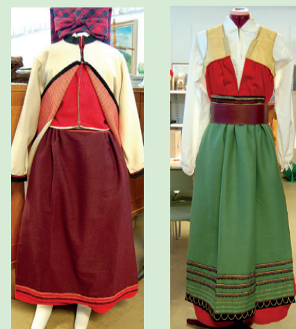
Vingåkersdräkter, vardags till vänster och en högtidsdräkt till höger.