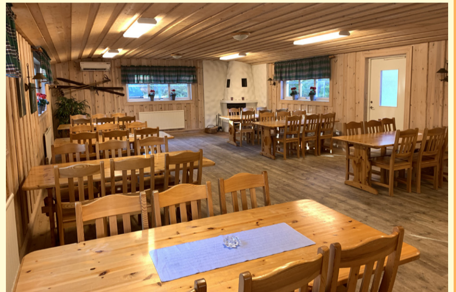
Stugan är möblerad med bord och stolar som rymmer ca 50 personer.

Förutom stugan, pulkabacken och skidspåren finns det löpspår och ett litet utegym samt toaletter. Gräsytan fungerar också som boll- och boccioplan. Arbetet med att underhålla och sköta om anläggningen sker till största del ide-