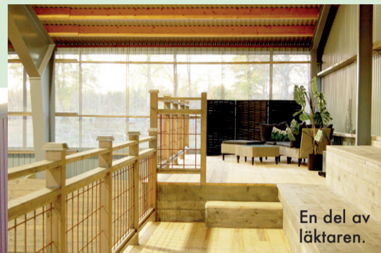
En del av läktaren.