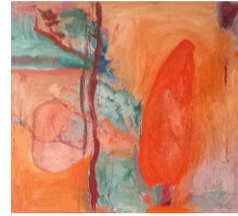
Karin Holgersson Olja, akryl, textil, blandteknik

Lördagarna 20 november, 27 november och 4 december kl 11 - 16 Söndagarna 21 november, 28 november och 5 december kl 11 - 16 Onsdagarna 24 november och 1 december kl 14 - 16