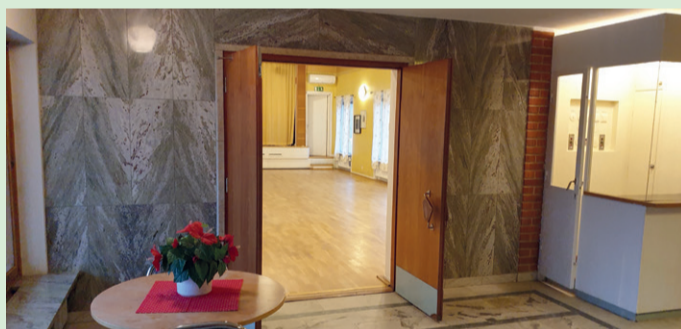
Samma vy idag 2021.