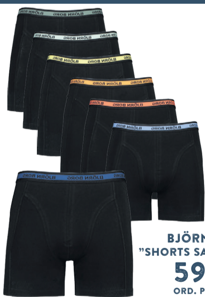
BJÖRN BORG "SHORTS SAMMY SOLID" 599:- ORD. PRIS 899:- STL. S-2XL

KOSTYMER I 70 OLIKA STORLEKAR ÖVER 100 KÄNDA VARUMÄRKEN 7000M 2 BUTIK