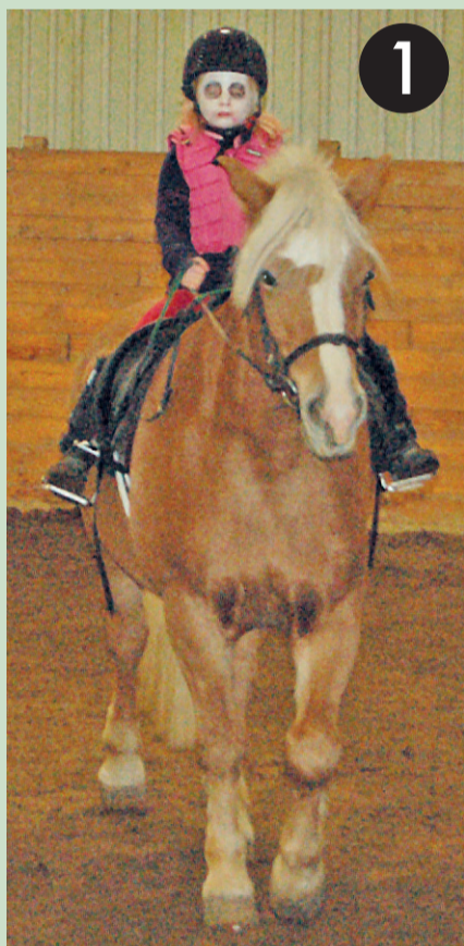
Några ur första gruppen. De rider över liggande bommar.