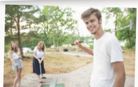
Vid kaffestugan finns en nyrenoverad Minigolfbana. Bollar och klubbor hyr du i glasskiosken eller i Kaffestugan.