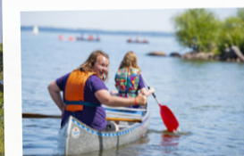
Kanoter, trampbåt, jollar och andra båtar finns att hyra i Kaffestugan. Fritt fiske i hela Hjälmaren.