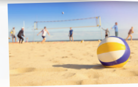
Beachvolleybollutrustning finns att låna.