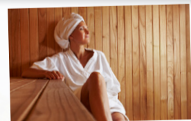
Bastun finns att boka alla dagar under hela sommaren. Bokning sker i receptionen.