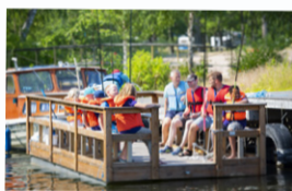
Bryggbåt finns att hyra i Kaffestugan. I priset ingår en styrman. Bryggbåten är tillgänglighetsanpassad.

Mer info hittar ni på www.hjalmargarden.se eller 0151-73 09 80