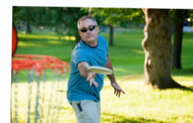
Frisbeegolf med nio st utmanande hål. Frisbees finns för uthyrning i receptionen.