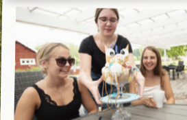
Kom och upplev någon av Kaffestugans kända glassmenyer!