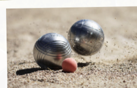
Boulebana finns att tillgå mellan campingen och badstranden.