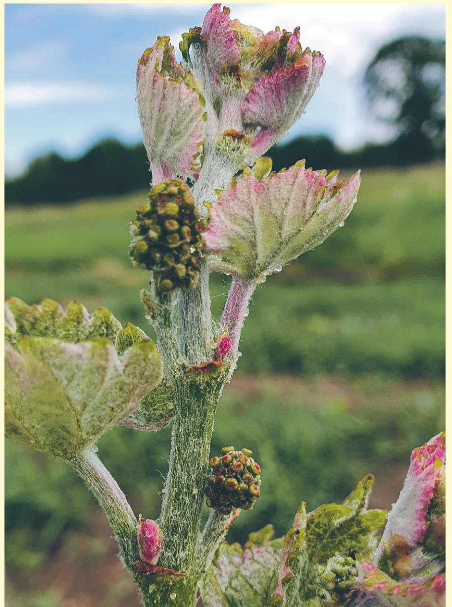
En blivande vinranka.

På frågan om de är mer driftiga på Vinön än på fastlandet svarar Åsa: – Mer driftiga vet jag inte, men öbor har ju ofta kombinerat många olika näringar och idéer. Min bild är att folk på ön har varit fiskare OCH jordbrukare i större utsträckning än på land, där man oftare