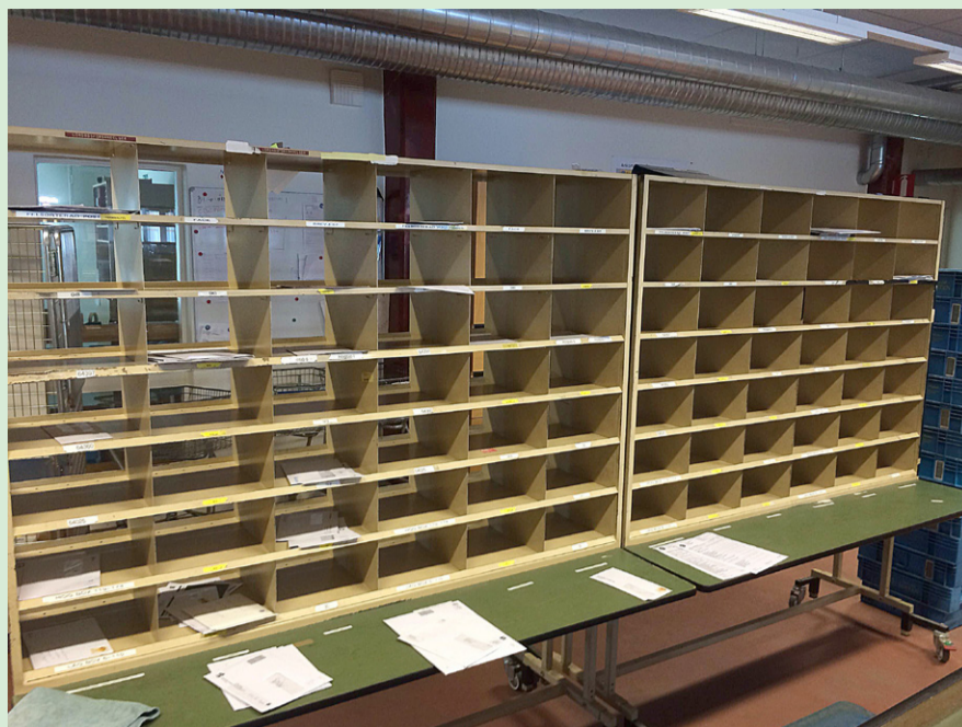
En gammal hederlig sorteringshylla. Används som försortering på de två sista siffrorna i postnr.

mellan kl. 06:20 och kl. 09:30 och man arbetar åtta timmar – det är inte som förr i tiden när brevbärare slutade när de var klara med sin runda och kunde åka ut och fiska redan innan lunch. Brevbärarna roterar turer så att man varierar att springa i trappor inne i samhället och sitta i bilen och köra i kommunens ytterområden.