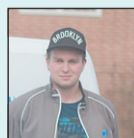
Marcus A. Vitvaruservice

Apoteksgatan 8, 643 30 Vingåker • Tel. 0151-51 84 80