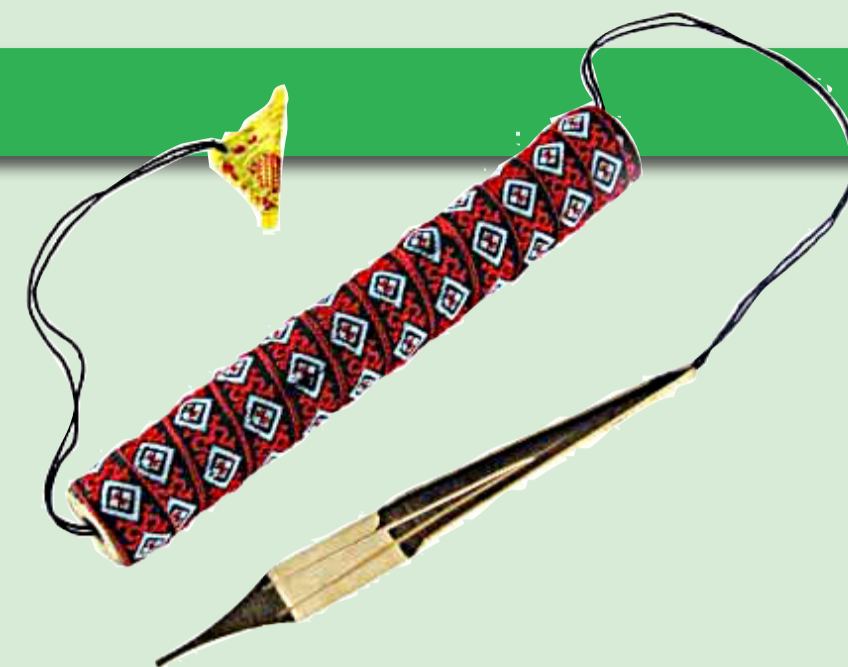
Vietnamesisk uråldrig mungiga.