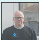
Micke W. Vitvaruleverantör

Samtliga erbjudanden gäller så långt lagret räcker, dock längst t.o.m. 24/9.