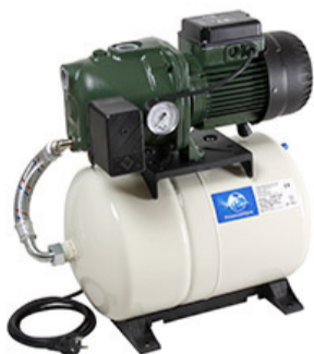
Beulco Aqua Jet 82 M med 60 l Hydropress