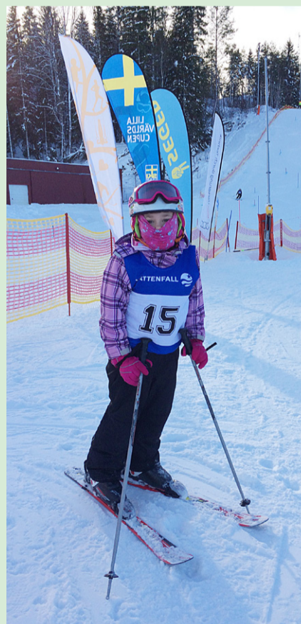
Båsenberga slalomklubbs nästa storsjärna?

Det är snabba bud i Båsenberga och förhoppningen är att det mesta ska vara klart till vintern. Byggnationen av samlingslokalen kommer starta inom de närmsta veckorna.