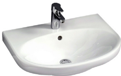
Tvättställ Gustavsberg inkl. blandare