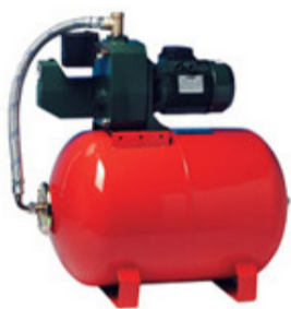
Beulco Aqua Jet 82 M med 20 l Hydropress