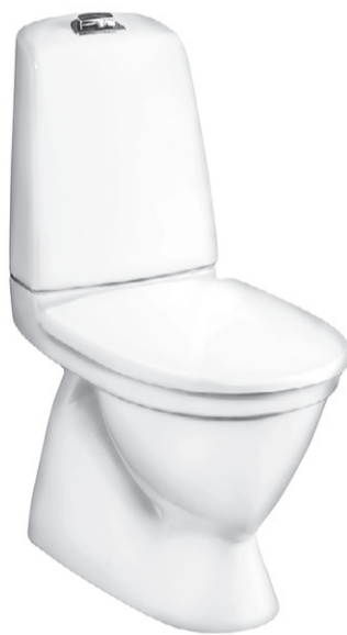
WC-stol Gustavsberg med dubbelspolning