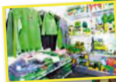
I vår väl sorterade butik finns saker för såväl stor som liten!