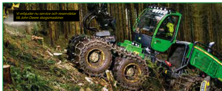
Vi erbjuder nu service och reservdelar till John Deere skogsmaskiner.

Baggetorp 0150 - 221 36 Ring för öppettider.