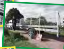
Vi har släpet för din last! Vi tillhandahåller hela Fogelsta-sortimentet.