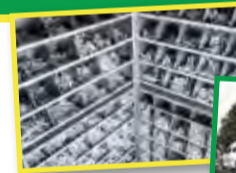
Vi har utökat vårt väl sorterade sortiment av skruv och mutter.