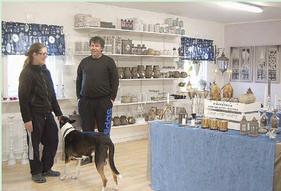
Princen, som är en korthårig Collie, viker inte gärna från mattes sida.

– Ja, men under lågsäsong har jag bara öppet på helgerna. Högsäsong från maj till oktober är öppet onsdag till söndag.