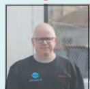
Micke W. Vitvaruleverantör

Samtliga erbjudanden gäller så långt lagret räcker, dock längst t.o.m. 13/4.