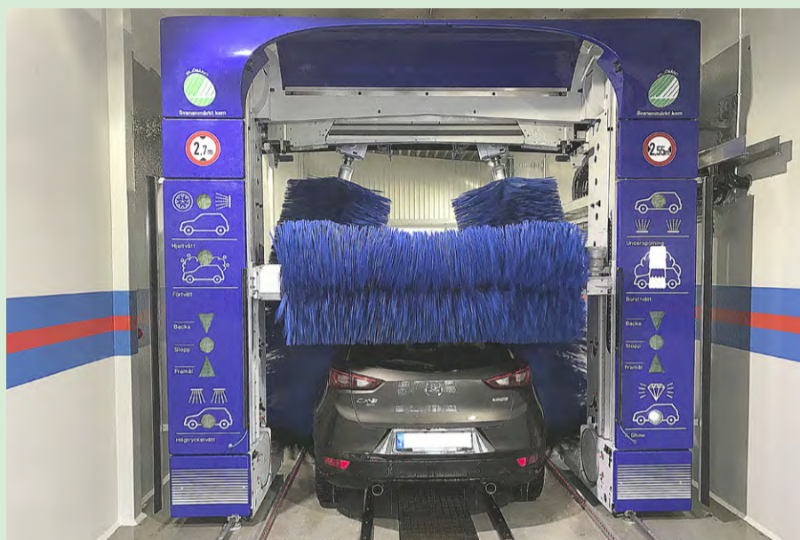
Den nya automatvätten på OKQ8.

Thomas berättar att även Gör-det-själv-hallen har fått sig en uppfräschning. Den är ommålad och med ny belysning, länkar till vatten och avfettning.